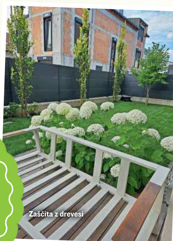
Zaščita z drevesi

»Nobena nova zasaditev ne da take energije kot drevo, zavetja, sence in kisika. DREVO JE VEDNO ELEMENT JANG LESA, PREDSTAVLJA STABILNOST, ZASČITO, NEPREMAKLJIVOST. «